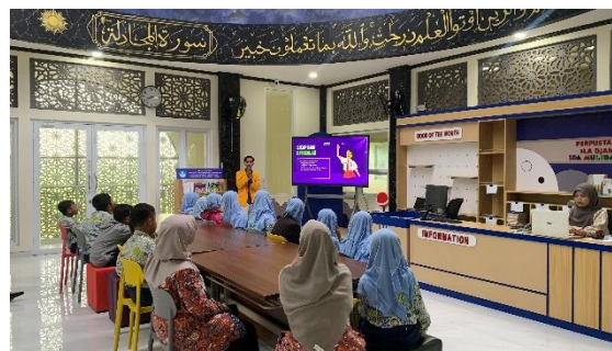
Gambar 3. Kegiatan Kelas Inspiratif

Kegiatan diawali dengan perkenalan bersama siswa kelas 4. Perkenalannya menggunakan bukan nama asli mereka. Setelah itu, siswa diberikan soal pretest untuk mengetahui pemahaman dan keterampilan siswa mengenai sekolah ramah anak, pendidikan karakter, dan kesadaran hukum. Selanjutnya pengabdian memberikan sedikit materi dan tanya jawab. Kegiatan ini bertema "Aku Anak Indonesia Hebat, Sekolah Bersahabat", dengan pembiasaan harian, berdongeng, cerita karakter, membuat pohon harapan, diskusi mini, dan permainan edukatif.