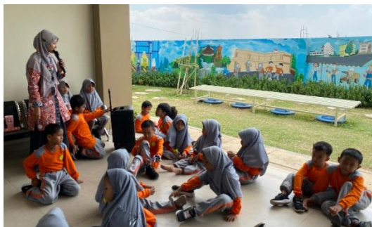
Gambar 2. Kegiatan observasi di SD