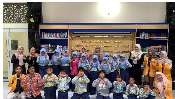
Gambar 4. Foto bersama siswa kelas 4