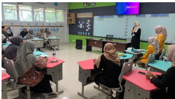
Gambar 5. Pemaparan materi

Tiga narasumber tersebut diberikan waktu kurang lebih 20 menit penyampaian materi dengan metode ceramah. Setelah pemaparan materi, dilakukan tanya jawab, studi kasus, dan berbagi pengalaman bersama guru.