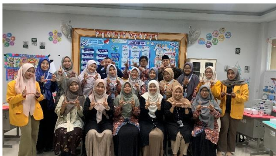
Gambar 6. Foto bersama guru