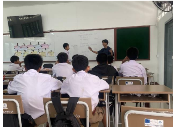
Gambar 2. Penerapan Teknik Drilling dan Repetition dalam Latihan Percakapan Bahasa Inggris Siswa

Peningkatan pada aspek pronunciation dan fluency sebagaimana terlihat pada Tabel 1 menunjukkan bahwa teknik drilling dan repetition memiliki peran yang signifikan dalam membantu siswa mengembangkan keterampilan berbicara. Skor pronunciation yang meningkat dari 64 menjadi 78 serta fluency dari 60 menjadi 76 menunjukkan bahwa pengulangan yang terstruktur mampu memperbaiki kualitas produksi bahasa siswa.