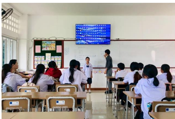
Gambar 3. Praktik Percakapan di Depan Kelas sebagai Upaya Meningkatkan Kepercayaan Diri (Confidence) Siswa

Secara teoretis, fenomena ini dapat dijelaskan melalui konsep affective filter hypothesis yang menyatakan bahwa faktor emosional seperti rasa percaya diri dan kecemasan berpengaruh terhadap proses pemerolehan Bahasa (Arifuddin et al., 2024). Ketika tingkat kecemasan menurun dan kepercayaan diri meningkat, siswa lebih terbuka untuk menerima input bahasa dan berani melakukan produksi bahasa. Sebaliknya, jika siswa terlalu fokus pada ketepatan sejak awal, hal ini dapat meningkatkan beban kognitif dan menghambat kelancaran berbicara.