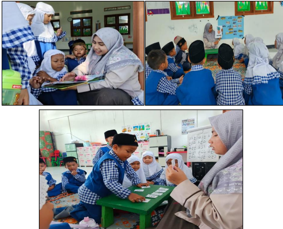
Gambar 3. Media Alat Permainan Edukatif

pendekatan yang berbeda pula untuk mendukung perkembangan bahasa mereka. Beberapa anak membutuhkan lebih banyak waktu dan perhatian untuk memahami dan mengungkapkan ide mereka, sementara yang lain dapat berbicara dengan lebih lancar dan mudah dipahami.