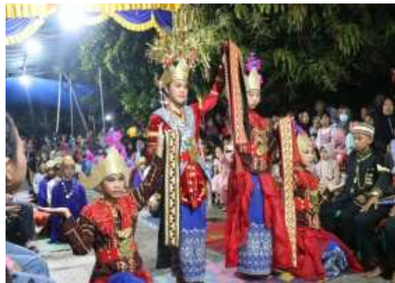
Gambar 4. Penampilan Peserta Lomba Tari dalam Tradisi Kekiceran