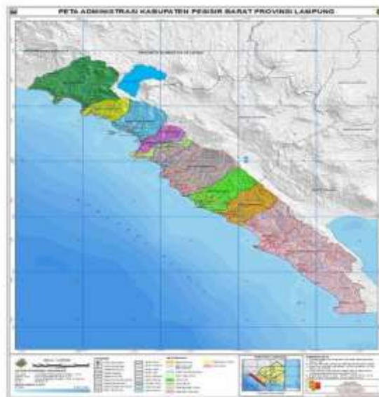
Gambar 1. Peta Kabupaten Pesisir Barat

menghargai leluhur terdahulu yang telah mengenal kan banyak tradisi budaya khususnya masyarakat Lampung daerah Krui Pesisir barat. Sejalan dengan falsafah hidup (Piil Pesenggiri) masyarakat Lampung sesuai dengan nilai kearifan lokal dalam tradisi Kekiceran, yaitu Nengah Nyappur. Sikap Nengah Nyappur melambangkan sikap nalar yang baik, tertib dan sekaligus merupakan embrio dari kesungguhan untuk menambah pengetahuan dan sikap adaptif terhadap perubahan. Dengan demikian, berarti masyarakat Lampung pada umumnya dituntut untuk dapat menempatkan diri, yaitu santun dalam perbuatan dan santun dalam bertutur kata. (Ariyani.2014:19).