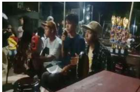
Gambar 5. Pengiring Tari dalam Tradisi Kekiceran