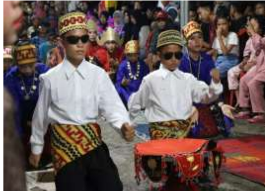
Gambar3. Lomba Tari dalam tradisi Kekiceran