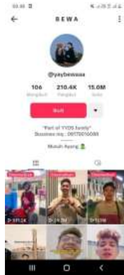
Gambar 3. Akun TikTok @yaybewaaa

Akun dengan nama @yaybewaaa sering juga membahas Bahasa Lampung di akunnya yang memiliki pengikut 210.4k dan 15.0m yang menyukai video darinya. Dalam beberapa video unggahannya yang membahas tentang Bahasa Lampung, seperti perbedaan Bahasa Lampung dialek A dan O, ada juga konten tentang logat Lampung yang khas dan beberapa video parodi.