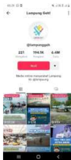
Gambar 2. Akun TikTok @lampunggeh

Akun TikTok selanjutnya yang dalam kontennya ngebahas juga tentang Bahasa Lampung adalah akun @lampunggeh. Akun ini sering sekali bahas tentang Lampung, dari berita terkini sampai informasi terkait pariwisata. Namun, banyak juga konten Bahasa Lampung yang di kemas dengan menarik agar penonton tidak bosan melihat video dari akun yang memiliki pengikut 194.1k dan suka sebanyak 6.4m. Di konten tentang Bahasa Lampung, akun ini menyajikan video tentang percakapan sehari-hari baik dari Lampung dialek O atau A.