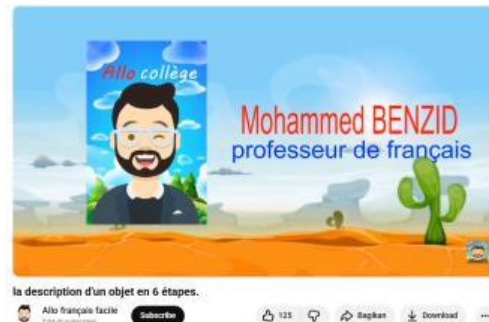
Gambar 1. Tampilan Cover Video

bahasa dalam kehidupan sehari-hari. Konten yang tersedia dinilai relevan dengan pembelajaran Production écrite Introductif , khususnya pada tema décrire un objet , karena menyajikan langkah-langkah mendeskripsikan objek secara sederhana sesuai tingkat A1. Berikut tampilan cover video dari kanal Allo Français Facile .