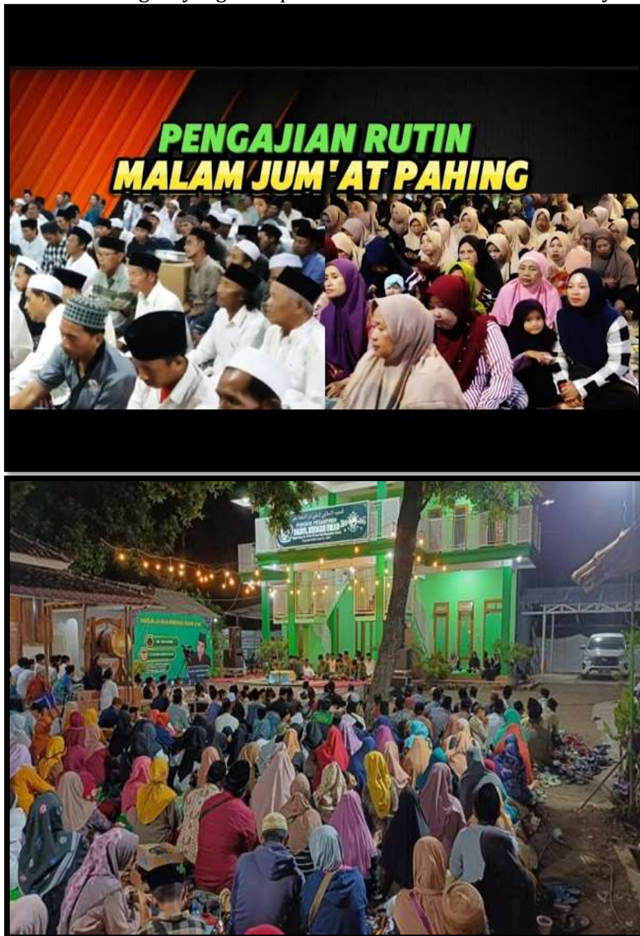
Gambar 1 dan 2. Pengajian Rutin Malam Jumat Pahing

Temuan ini sejalan dengan pendapat (Clark & Mayer 2016) yang menyatakan bahwa pembelajaran berbasis interaksi sosial dan pengulangan (repetition) mampu meningkatkan daya serap dan pengamalan nilai keagamaan secara signifikan. Dalam konteks Desa Tambak Lekok, pengajian Jumat Pahing menjadi bentuk nyata dari pembelajaran sosial-religius yang memperkuat nilai ubudiah kolektif masyarakat.