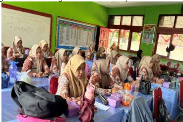
Gambar 5. Peserta Pelatihan Penulisan Cerita Anak Edukatif

Kegiatan ditutup dengan pembacaan karya peserta, diskusi, serta posttest untuk mengukur peningkatan hasil belajar. Hasil posttest menunjukkan rata-rata skor 89, meningkat secara signifikan dibandingkan rata-rata skor pretest sebesar 62.