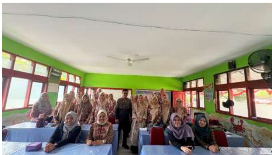
Gambar 6. Foto bersama peserta pelatihan dan tim pengabdian