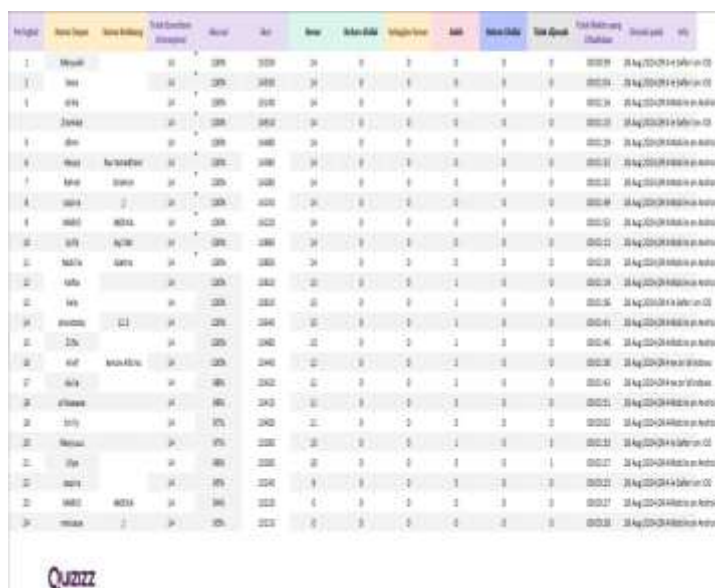
Gambar 4. Hasil post-test

Sesi berikutnya dibawakan oleh Yinda Dwi Gustira, M.Pd., dengan materi “Integrasi Nilai-Nilai Karakter dalam Cerita Anak”. Peserta mempraktikkan cara menggabungkan nilai kejujuran, kerja sama, dan tanggung jawab ke dalam tokoh dan konflik cerita. Setelah itu, peserta menulis cerita anak secara individu dengan panjang 500–800 kata dan melakukan penyuntingan bersama tim pengabdian.