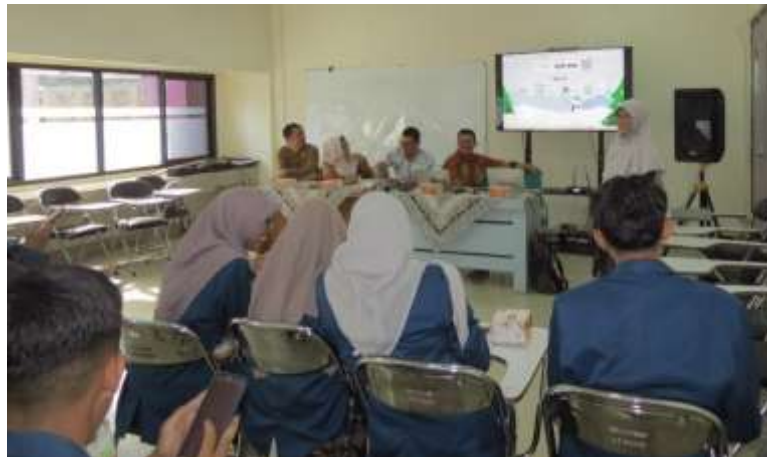
Gambar 3. Pemberian soal pre-test dan post-test menggunakan “Kahoot”