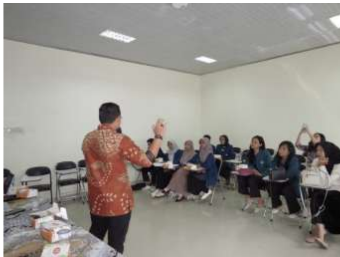
Gambar 5. Peserta mendapat pengarahan untuk menulis puisi bertema lingkungan (dokumen Tim PKM, 2025)

Pelatihan musikalisasi puisi yang diikuti oleh 20 orang mahasiswa di Jurusan Pendidikan Bahasa dan Seni FKIP Unila ini dirancang untuk meningkatkan keterampilan dan kreativitas peserta dalam menulis puisi. Pelatihan ini tidak terbatas pada pemberian teori saja, namun juga praktik secara langsung. Peserta pelatihan praktik untuk menulis puisi yang difokuskan pada tema tentang lingkungan (gambar 5). Selain fokus pada aspek teknis, pelatihan ini juga menanamkan prinsip-prinsip peduli terhadap lingkungan melalui kegiatan diskusi dan kerja kelompok. Materi pelatihan mencakup teori dasar puisi, keterampilan menulis puisi, ide dalam puisi, dan menulis puisi bertema ekologis. Metode yang digunakan meliputi demonstrasi oleh instruktur atau pematari (dosen), workshop praktik, diskusi kelompok, dan evaluasi hasil karya peserta. Hasil pelatihan ini menunjukkan peningkatan dalam pemahaman dan keterampilan menulis puisi dan pemahaman tentang puisi.