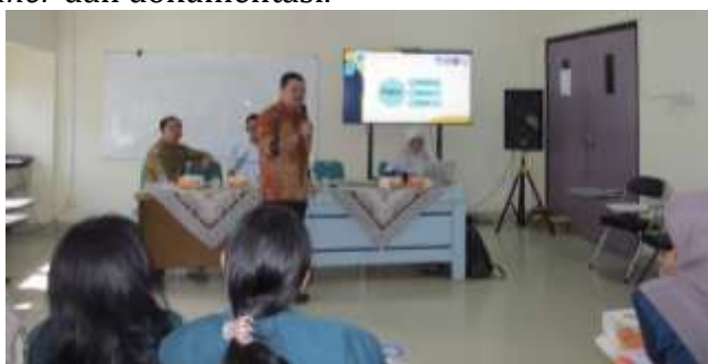
Gambar 1. Tim PKM memberikan pengantar materi menulis puisi

Pelaksanaan kegiatan PKM terdiri dari tiga tahap: (1) perencanaan atau pra-kegiatan; (2) pelaksanaan; dan (3) evaluasi kegiatan. Pada tahap pra-kegiatan, dilakukan koordinasi dan publikasi dengan mitra PKM. Tim PKM mengunjungi lokasi kegiatan dua kali untuk berkomunikasi langsung. Selanjutnya, tim melakukan pendataan peserta dengan menyiapkan formulir isian. Diskusi antara pihak mitra PKM dan tim PKM membahas persiapan teknis serta pihak yang terlibat dari mahasiswa. Tim kemudian menyiapkan materi pelatihan (makalah) dan berkoordinasi untuk persiapan atribut kegiatan seperti banner dan dokumentasi.