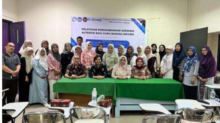
Gambar 4. Foto bersama tim pelaksana dan peserta pelatihan

Menjelang penutupan, setiap peserta menyusun rencana aksi penerapan minimal satu tugas asesmen autentik dalam dua minggu berikutnya, lengkap dengan strategi umpan balik dan dokumentasi portofolio siswa. Kegiatan ditutup dengan posttest dan kuesioner kepuasan. Tim membagikan materi, template rubrik, bank contoh tugas, serta instrumen pre-post untuk mendukung implementasi di sekolah masing-masing.