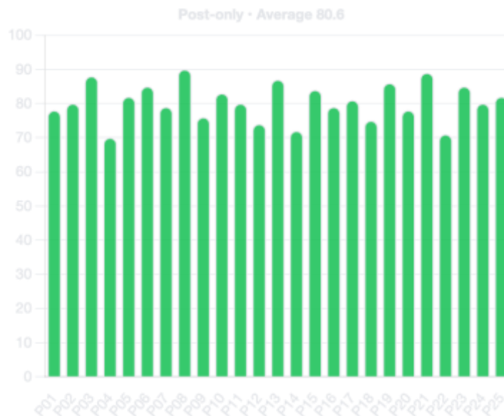
Gambar 6. Sebaran skor posttest peserta (rata-rata 81,3)

Kuesioner kepuasan dengan skala 1–5 mencatat skor rata-rata 4,4. Aspek tertinggi adalah relevansi materi dengan Kurikulum Merdeka dan kejelasan penyajian. Hambatan utama mencakup variasi kemampuan awal peserta, keterbatasan akses TIK di sebagian sekolah, dan manajemen waktu untuk penskoran tugas performatif pada kelas besar. Tim menanggapi dengan menyediakan template rubrik siap pakai, opsi tugas low-tech atau luring, serta panduan kalibrasi cepat antarguru.