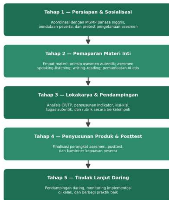
Gambar 1. Alur tahapan pelaksanaan kegiatan

Evaluasi dilakukan secara kuantitatif dan kualitatif. Aspek kuantitatif diukur melalui pretest–posttest pengetahuan asesmen sebanyak 20 butir campuran pilihan ganda dan isian singkat. Aspek kualitatif dinilai melalui kuesioner kepuasan, tanggapan peserta, serta rubrik internal terhadap perangkat yang dihasilkan dengan kriteria keselarasan dengan CP/TP, autentisitas tugas, kejelasan rubrik, dan keterpakaian di kelas. Kegiatan dinyatakan berhasil apabila minimal 75% peserta merespons positif dan mampu menyusun perangkat asesmen autentik berkategori baik. Alur tahapan pelaksanaan ditampilkan pada Gambar 1.