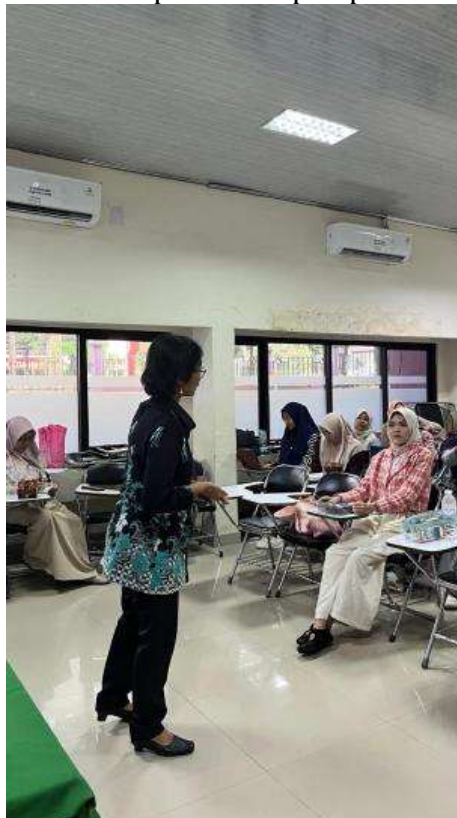
Gambar 3. Narasumber memberikan penjelasan materi kepada peserta

Penyampaian materi berlangsung melalui paparan interaktif, diskusi, dan lokakarya. Peserta bekerja dalam kelompok kecil untuk merancang satu tugas asesmen autentik lengkap beserta rubrik analitiknya. Tim juga mendemonstrasikan pemanfaatan AI untuk menghasilkan variasi konteks tugas yang tetap selaras tujuan, menyusun draf rubrik, menganalisis pola kesalahan umum pada tulisan siswa, dan menyiapkan exemplar beranotasi bagi pelatihan penilai. Aspek etika ditekankan melalui pendekatan AI-assisted, student-owned, yakni karya akhir tetap milik siswa dengan jejak proses yang terdokumentasi dan validasi manusia pada setiap keputusan penilaian.