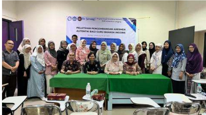
Gambar 4. Foto bersama tim pelaksana dan peserta pelatihan

Menjelang penutupan, setiap peserta menyusun rencana aksi penerapan minimal satu tugas asesmen autentik dalam dua minggu berikutnya, lengkap dengan strategi umpan balik dan dokumentasi portofolio siswa. Kegiatan ditutup dengan posttest dan kuesioner kepuasan. Tim membagikan materi, template rubrik, bank contoh tugas, serta instrumen pre-post untuk mendukung implementasi di sekolah masing-masing.