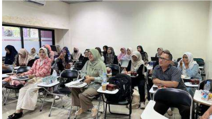
Gambar 2. Peserta menyimak pemaparan materi dari tim pelaksana

rubrik yang membedakan pemahaman literal, inferensial, dan evaluatif. Pada menyimak, peserta merespons audio otentik seperti pengumuman publik dan instruksi prosedural. Pada menulis, pelatihan menggarisbawahi siklus draf, umpan balik, dan revisi untuk audiens nyata.