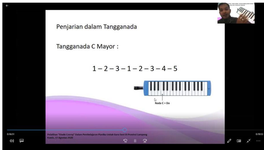
Gambar 2. Pemaparan Materi oleh Pemateri 2

Pada kegiatan pelatihan hari ke 3, peserta melakukan latihan mandiri dengan menerapkan materi yang telah diperoleh dari pemateri untuk dipraktikkan secara langsung dengan menggunakan instrumen pianika. Peserta diwajibkan untuk melaporkan hasil pembelajaran mandiri tersebut dalam bentuk video yang diupload melalui WhatsApp Group , kemudian pemateri melakukan penilaian terhadap hasil tersebut, guna mengetahui tingkat ketercapaian peserta terhadap materi pelatihan yang telah diberikan. Salah satu sampel hasil latihan mandiri yang dilakukan oleh peserta dapat dilihat dalam gambar berikut.