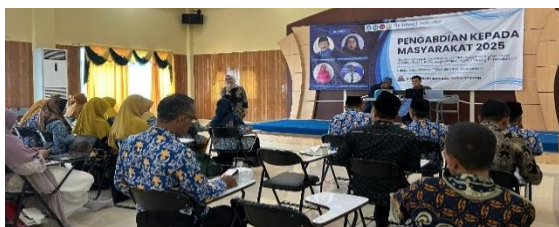
Gambar 1. Pelaksanaan Kegiatan PkM

Setelah pemberian soal pretest, kegiatan dilanjutkan dengan pemaparan materi oleh dosen tim pengabdian. Pemaparan diawali dengan materi penyusunan instrument HOTS dan penyusunan instrument 7C. Peserta bimtek mengikuti kegiatan bimtek dan memperhatikan dengan baik pemaparan materi dari tim pengabdian seperti yang disajikan pada Gambar 1 berikut.