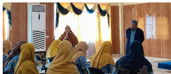
Gambar 2. Sesi Tanya Jawab dan Diskusi

tingkat kesukaran instrument 7C dan HOTS. Adapun peserta yang ingin diskusi lebih lanjut mengenai instrument asesmen 7C dan HOTS dalam berbagai mata pelajaran di sekolah seperti yang disajikan pada Gambar 2 berikut.