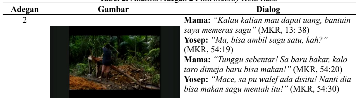
Gambar 2. Memeras Sagu

Berdasarkan data yang dianalisis dalam film Melody Kota Rusa , kearifan lokal masyarakat Papua Marind Anim yang direpresentasikan melalui adegan pemanfaatan sumber daya alam yang selaras dengan nilai-nilai budaya setempat. Salah satu bentuk kearifan lokal yang ditampilkan dalam film tersebut terlihat pada memeras teras batang atau bagian dalam batang pohon sagu. Sagu sebagai bahan pangan utama memiliki peran penting dalam kehidupan masyarakat Papua khususnya suku Marind Anim dan menjadi simbol keterikatan antara manusia dengan lingkungan alamnya. Proses memeras sagu yang digambarkan dalam film tidak sekadar menunjukkan aktivitas teknis pengolahan bahan pangan, tetapi juga melakukan tradisi yang telah berlangsung secara turun-temurun. Aktivitas tersebut menandakan adanya pengetahuan lokal yang berkembang seiring dengan kondisi ekologis wilayah Papua di mana pohon sagu tumbuh subur dan dimanfaatkan secara optimal oleh semua masyarakat Marind Anim. Bagian utama pohon sagu yang dimanfaatkan adalah teras batang yang diolah melalui proses tradisional, masyarakat Marind Anim memeras sagu pada bagian teras batang pohon dengan memukul pati sagunya menggunakan alat tradisional bambu lalu memerasnya secara manual menggunakan kedua tangan.