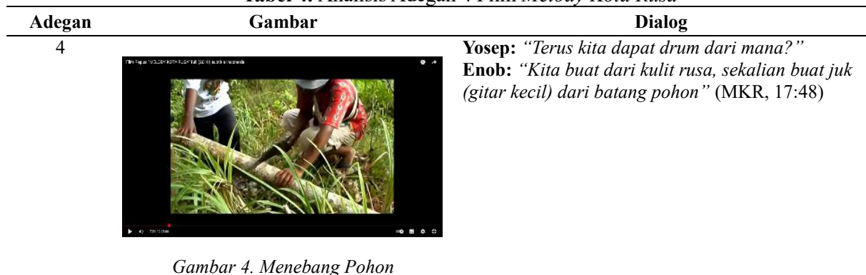
Gambar 4. Menebang Pohon