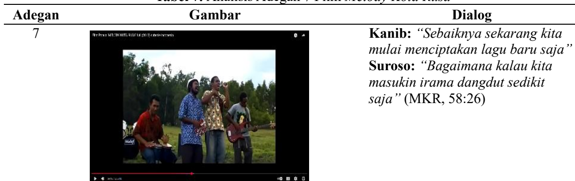
Gambar 7. Menyanyikan Lagu Lintas Budaya