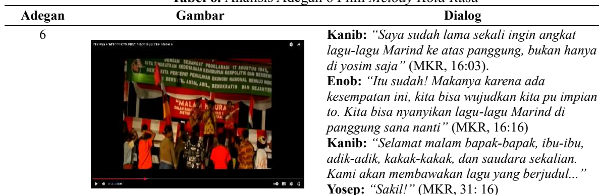
Gambar 6. Menyanyikan Lagu Suku

Berdasarkan data yang dianalisis dalam film Melody Kota Rusa , kearifan lokal masyarakat Papua direpresentasikan melalui adegan kesenian tradisional yang berfungsi sebagai sarana pengetahuan budaya. Salah satu bentuk kearifan lokal yang ditampilkan dalam film tersebut adalah kebiasaan masyarakat Marind dalam menyanyikan lagu suku sebagai bagian dari kehidupan sosial dan budaya mereka, lagu suku tidak hanya dipahami sebagai hiburan, melainkan sebagai wujud ekspresi budaya yang mengandung nilai-nilai sosial yang diwariskan secara turun-temurun. Dalam film tersebut, masyarakat Marind digambarkan sering menyanyikan lagu suku pada saat berlangsungnya acara besar maupun ketika melakukan tarian yosim pada malam hari. Aktivitas ini biasanya dilakukan secara bersama-sama dengan mengelilingi api unggun, yang menciptakan suasana kebersamaan antara anggota masyarakat.