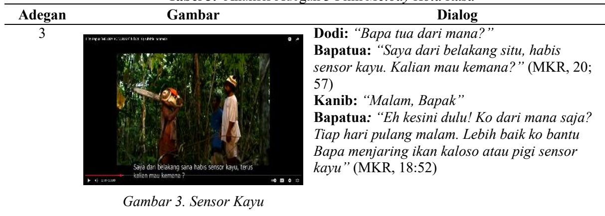
Gambar 3. Sensor Kayu

Berdasarkan data yang dianalisis dalam film Melody Kota Rusa , kearifan lokal masyarakat Papua, khususnya Suku Marind Anim, direpresentasikan melalui aktivitas memotong kayu dengan menggunakan senjata modern berupa mesin gergaji. Penggunaan alat ini memudahkan masyarakat dalam menebang pohon dan menunjukkan adanya interaksi antara perkembangan teknologi dengan praktik budaya lokal. Aktivitas menebang pohon tersebut digambarkan sebagai salah satu bentuk mata pencaharian yang menopang kehidupan ekonomi masyarakat setempat. Pemanfaatan mesin gergaji dalam kegiatan menebang kayu mencerminkan proses adaptasi masyarakat Marind Anim terhadap perubahan zaman tanpa sepenuhnya meninggalkan nilai-nilai kearifan lokal.