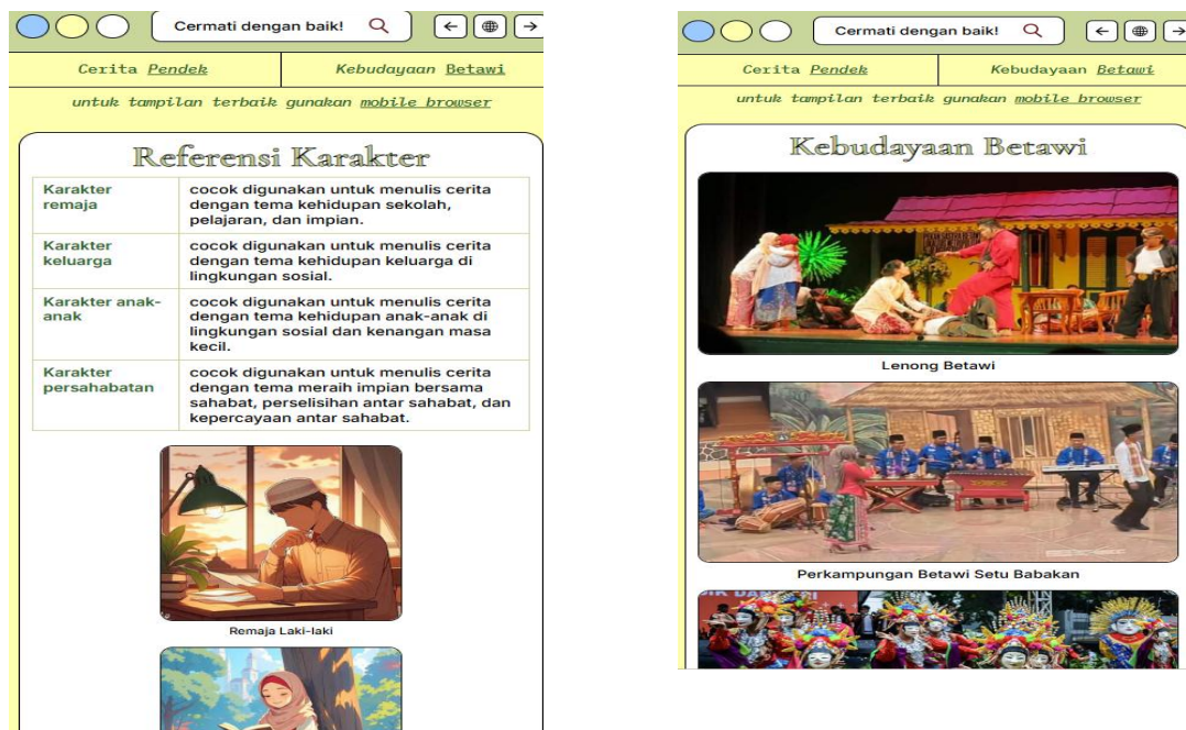
Gambar 3. Halaman Kebudayaan Betawi dan Referensi Karakter pada Media Pembelajaran Web Literasi

Hasil tugas menulis cerpen milik peserta didik di kelas eksperimen dengan nilai tertinggi mendapat nilai 95. Penilaian ini ditinjau dari beberapa aspek. Pada aspek pertama memuat terpenuhinya empat ciri cerpen, berisi 3000 kata atau lebih, habis dibaca dalam waktu maksimal 10 menit, dan hanya terfokus pada satu tokoh serta satu konflik. Pada cerpen di atas, peserta didik memfokuskan cerita hanya pada Aisyah dan konflik batin yang menderanya. Dengan isi cerita yang padat, bagian yang tidak terpenuhi hanya panjang cerita yang kurang dari 3000 kata. Dengan demikian, nilai yang diperoleh pada komponen pertama adalah 3.