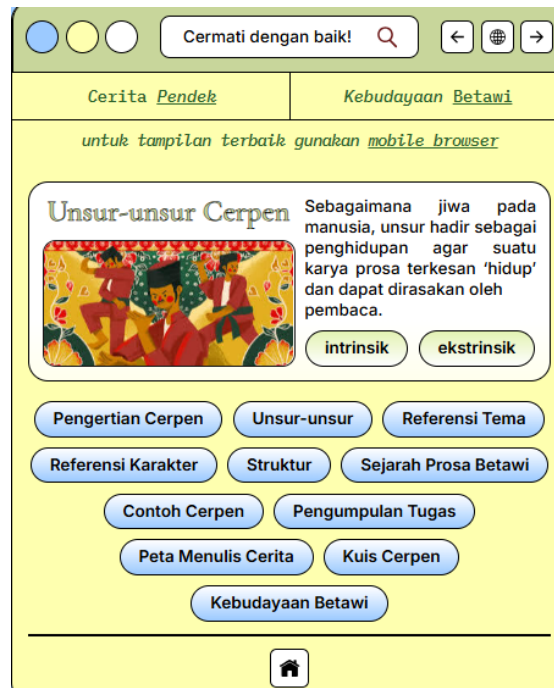
Gambar 2. Halaman Unsur-unsur cerpen dan Sejarah Cerita Rakyat Betawi pada Media Pembelajaran Web Literasi