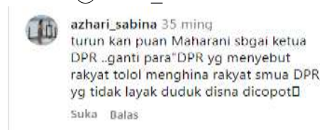
Gambar 5. Komentar Bentuk Provokasi

Pada komentar di atas " turun kan puan Maharani sbgai ketua DPR.. ganti para DPR yg menyebut rakyat tolol menghina rakyat smua DPR yg tidak layak duduk disna dicopot. " Kata " turunkan " digunakan sebagai seruan terbuka yang menghasut khalayak untuk mendesak tokoh tersebut melepaskan jabatannya. Frasa " ganti para DPR yang menyebut rakyat tolol " membangun narasi penghasutan yang menciptakan citra negatif terhadap sebuah lembaga negara secara menyeluruh. Kata " dicopot " digunakan sebagai tuntutan langsung yang menggerakkan opini publik untuk menghendaki pemberhentian paksa, sehingga komentar ini berpotensi menimbulkan kebencian dan permusuhan terhadap tokoh dan lembaga yang dituju di ruang publik digital.