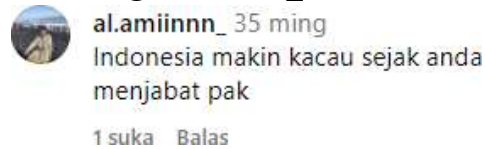
Gambar 4. Komentar Bentuk Perbuatan Tidak Menyenangkan

Pada komentar di atas " Indonesia makin kacau sejak anda menjabat pak. " Kata " makin " dalam KBBI bermakna lebih dari sebelumnya atau semakin, digunakan untuk membangun narasi perbandingan temporal yang bersifat negatif. Kata " kacau " dalam KBBI bermakna tidak teratur atau dalam keadaan huru-hara, yang dikaitkan secara langsung dengan masa jabatan seseorang melalui frasa " sejak anda menjabat. " Frasa tersebut berfungsi sebagai penanda kausalitas sepihak yang menempatkan tokoh tersebut sebagai satu-satunya pihak yang bertanggung jawab atas segala permasalahan tanpa disertai bukti yang dapat diverifikasi, sehingga berpotensi merugikan nama baik dan kredibilitas seseorang di ruang publik digital.