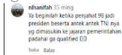
Gambar 2. Komentar Bentuk Pencemaran Nama Baik