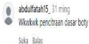
Gambar.1 Komentar Bentuk Penghinaan

Pada komentar di atas " Wkwkwk pencitraan dasar boty " pada unggahan bertema silaturahmi Presiden dengan Partai Golkar. Kata " dasar " dalam KBBI bermakna asal atau pokok, namun dalam pemakaian sehari-hari digunakan sebagai kata seru yang bersifat merendahkan. Kata " boty " merupakan bentuk tertulis dari " banci " yang dalam konteks informal digunakan sebagai ejekan terhadap identitas gender seseorang, khususnya laki-laki yang dianggap berperilaku feminin. Tawa " wkwkwk " memperkuat nada ejekan dalam komentar tersebut, sehingga secara keseluruhan ujaran ini merendahkan seseorang dengan menyerang karakter dan identitasnya secara negatif.