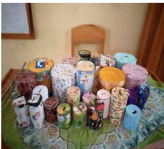
Gambar 2. Project Membuat Celengan Siswa