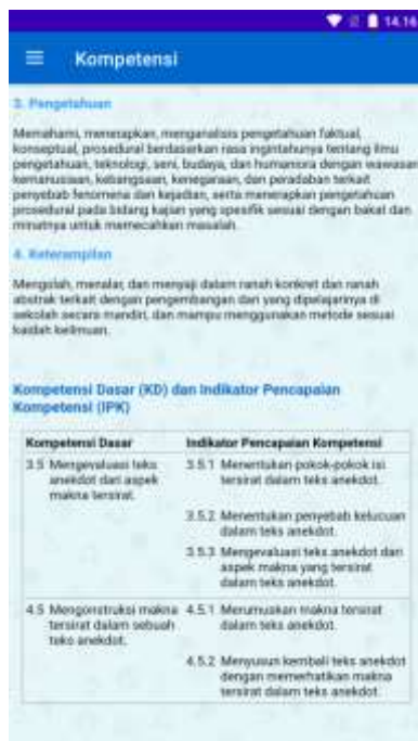
Tampilan Sebelum Diperbaiki