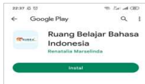
Gambar 1. Tampilan aplikasi pada google playstore

Hasil produk media mobile learning dapat diunduh pada google playstore atau diakses melalui alamat tautan sebagai berikut https://play.google.com/store/apps/details?id=com.rubbi.ndo.rubba .