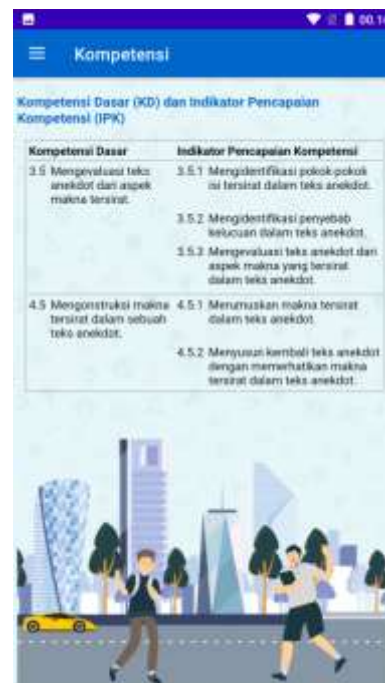
Gambar 2. Tampilan Hasil Perbaikan Indikator Pencapaian Kompetensi