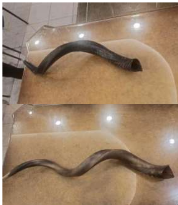
(Gambar 2: Shofar Tanduk Domba Jantan,

"ketika panas, supaya bisa menghasilkan suara yang suka dibengkokin" (Wawancara Wawan, 21 Mei 2025) Hal ini menunjukkan bahwa signifier fisik shofar adalah produk dari 'pembentukan' yang bertujuan untuk mengoptimalkan fungsi akustiknya, sehingga menjadikannya objek yang tidak pasif tetapi sarat makna melalui intervensi manusiawi.