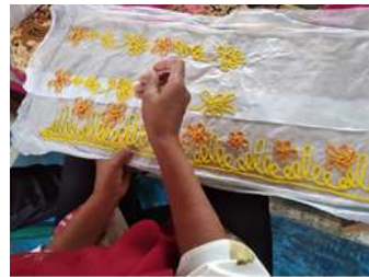
Gambar 5. Prosedur Jelujur menempel Benang Kepang ke motif

Sebelum memulai proses penyulaman, langkah krusial adalah mempersiapkan pola dasar pada bahan yang akan dihias. Pola ini digambar terlebih dahulu pada kertas minyak atau kertas berukuran besar, disesuaikan dengan desain yang diinginkan. Misalnya, jika ingin membuat taplak meja, kita akan menggambar berbagai bentuk alur yang diinginkan pada kertas tersebut. Alur ini bisa bervariasi, mulai dari garis lurus, melengkung, berbentuk ombak, zigzag, hingga bentuk-bentuk objek lainnya.