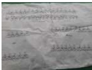
Gambar 4. Pola Motif Alam pada Kertas

Benang jahit yang secara teliti diuraikan menjadi beberapa helai, yaitu 16, 18, atau 21 helai, tergantung pada kebutuhan dan desain yang diinginkan. Setelah diuraikan, helai-helai benang tersebut kemudian dipilin atau dikepang, menyerupai teknik mengepang rambut. Proses pilin atau mengepang inilah yang memberikan tekstur dan karakter khas pada sulaman. Sementara itu, untuk pewarnaan, para pengrajin memiliki kebebasan penuh, sesuai dengan kreativitas mereka, memungkinkan terciptanya variasi warna yang kaya dan menarik.