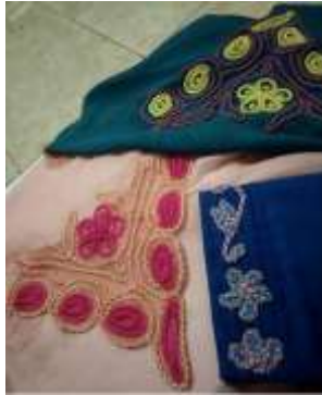
Gambar 6. Penggabungan Motif Kepang pada Jilbab

mengisi area yang telah dipola. Sementara itu, untuk bagian-bagian yang kosong atau tidak bermotif, penyulaman dilakukan menggunakan benang nilon, memberikan kontras dan tekstur yang menarik pada keseluruhan Sulam Jalin Kepang .