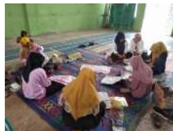
Gambar 2. Proses menyulam isian motif

Sulam Jalin Kepang menghiasi baju casual, kebaya, baju koko, hingga beragam perabot rumah tangga. Selain itu, sulaman ini juga memperindah tatakan/tutup cangkir, selendang, tempat tisu, peci, dompet, jilbab, dan berbagai aksesori lainnya, sehingga menunjukkan fleksibilitas serta adaptasi kerajinan ini dalam memenuhi kebutuhan selera pasar modern.