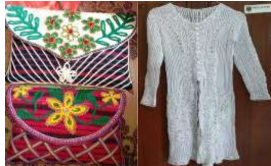
Gambar 1. Hasil Sulam Jalin Kepang

berevolusi jauh melampaui aplikasi tradisionalnya. Keindahan dan keunikan teknik ini diaplikasikan pada berbagai produk kerajinan lainnya.